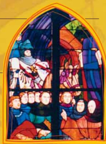
Bertrand du Guesclin

L'histoire de Dinan ne se fige pas à la fin du Moyen Âge. Deux siècles de paix relative permettent à la ville de se construire un nouveau visage ; de place forte, elle devient ville de couvents. La société aisée délaisse les maisons en pans de bois pour des hôtels particuliers en pierre.